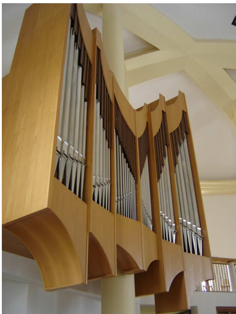
řk kostel Louka u Veselí nad Moravou (II/20)

1/ Přemístění a rekonstrukční úpravu varhan II/20 do římskokatolického kostela Panny Marie Růžencové v Louce u Veselí nad Moravou. Projektovaná moderní mohutná dubová varhanní skříň, tvarem nejčastěji připomínající motýla, je v perspektivu rozvržena do šesti věží, které jsou jak výškově, tak prostorově členěny. Z dispozičních i výtvarných důvodů nestojí varhany celým svým půdorysem na podlaze kůru, jak bývá obvyklé, ale jsou z části zavěšeny na betonový sloup před kůrem a vysunuty do prostoru kostela. Toto řešení působí dojmem nebývalé lehkosti a výborně zapadá do architektonického řešení interiéru kostela. Varhany byly zkolaudovány v říjnu 2003 na svátek Panny Marie.