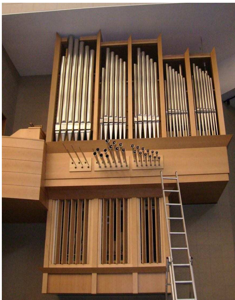
nové varhany (III/22) – Aula VŠB-TU Ostrava

3/ Varhanářská firma Robert Ponča Varhany uskutečnila v roce 2006 stavbu nového třímanuálového nástroje s pedálem pro Vysokou školu báňskou-Technickou univerzitu Ostrava do nově vybudovaného komplexu auly na ulici 17. listopadu v Ostravě-Porubě. Moderní zvuková i architektonická koncepce nástroje s elektrickou trakturou zahrnuje využití řady pomocných zařízení pro ovládání varhan. Unikátnost nástroje spočívá i v netradičně řešeném umístění varhan, které jsou zavěšeny na strop a boční stěnu sálu. Dispozice varhan je mimo jiné obohacena horizontální jazykovou řadou rejstříku Trompete 8'. Technické příslušenství sálu (s kapacitou 460 osob) tvoří nahrávací a překladatelské studio, sekce pro novináře, jeviště vybavené nejmodernější audiovizuální a divadelní technologií.