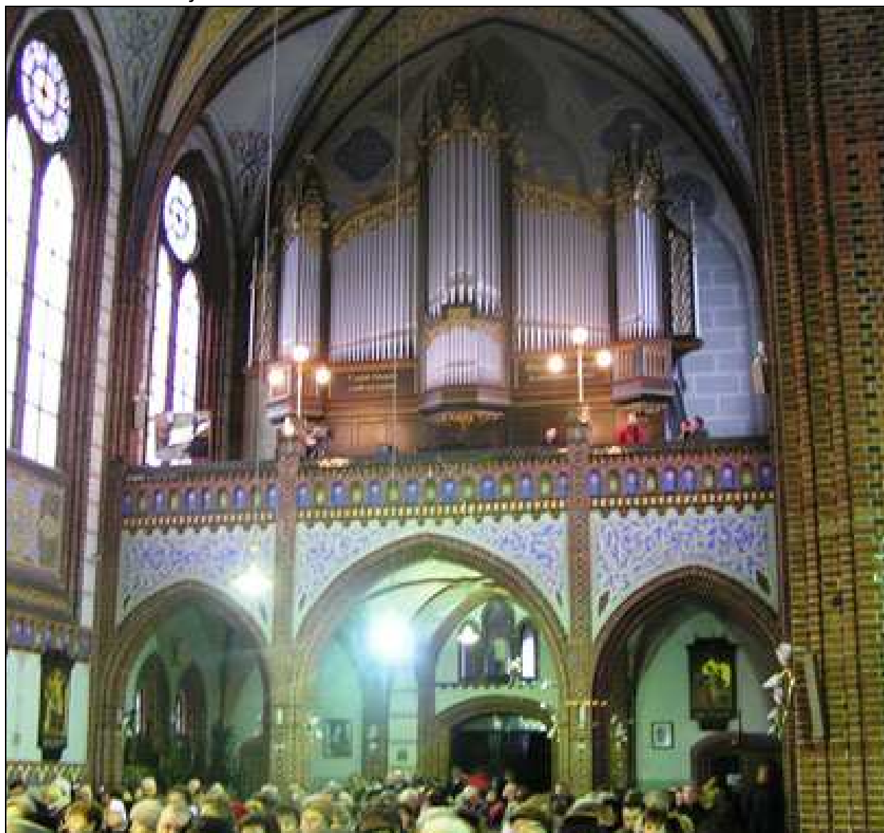
rekonstrukce (II/45) – Ludgeřovice u Ostravy, řk kostel